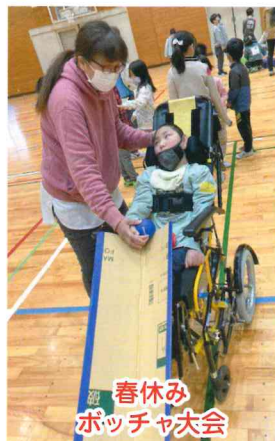
春休みポッチャ大会

春休みには今日は何をしようかな...と、利用者さんたちと一緒に考えながら計画を立てました。大好きな公園、お花見ドライブ、雛人形やダムの見学、カラオケにボウリング、電車の旅と盛り沢山。丘の上スタンプラリーやポッチャ大会にも参加しました。お友達の面倒を見たり、相手の気持ちを思い互いに譲り合う姿も見られました。色々な体験を通して利用者さんの成長を感じることが出来た春休みでした。