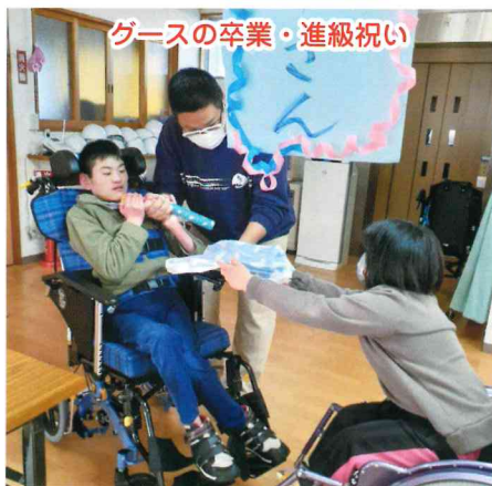
グースの卒業・進級祝い

3月7日に卒業・進級お祝いパーティーをしました。卒業される利用者さんに、みんなで書いた寄せ書きとアルバム式のカレンダーのプレゼントをして、みんなでケーキを食べてお祝いをしました。