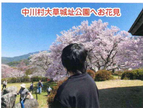
中川村大草城址公園へお花見

春休みには、中川村の大草城址公園へお花見に行ってきました。桜も丁度満開の時期で、美しい桜の花を