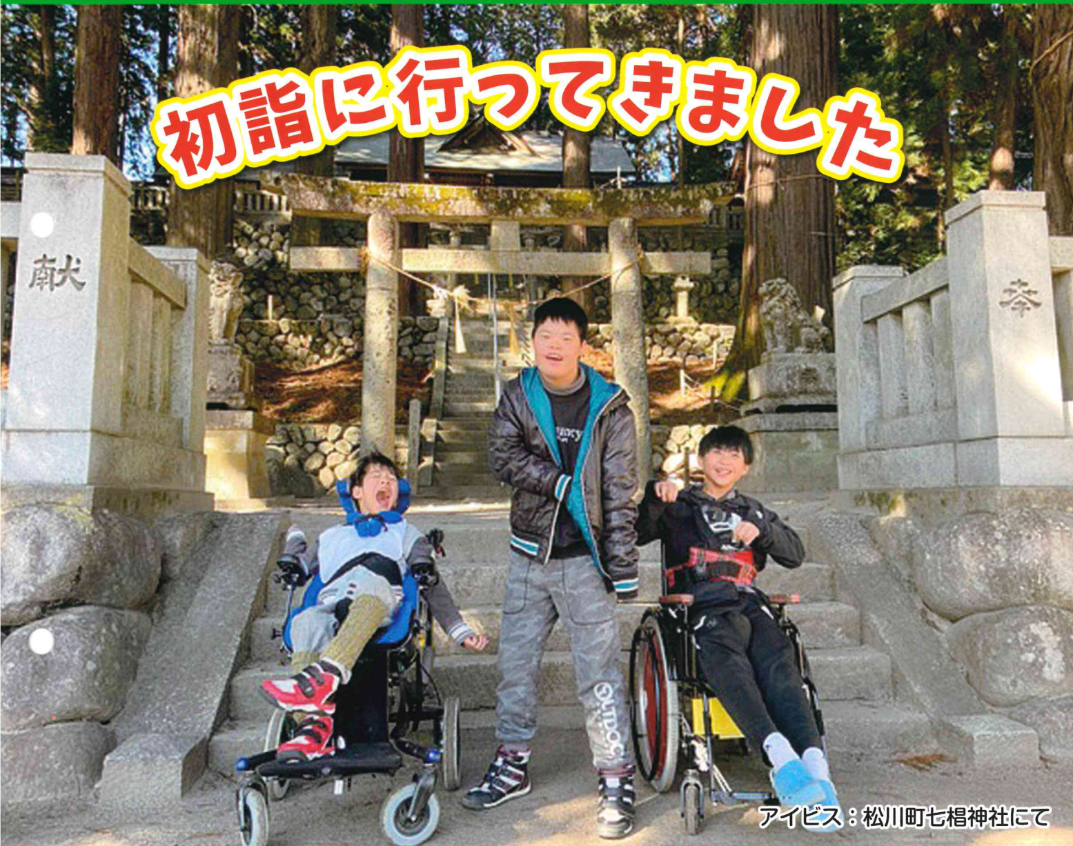
アイビス: 松川町七椏神社にて