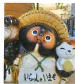
匿名 孝行むすこさん (ヘルパーステーション小川)

ジャニーズ、映画、ドラマをたくさん見ていっぱい笑う ♡おしゃれて、お出かけもしたいな♡