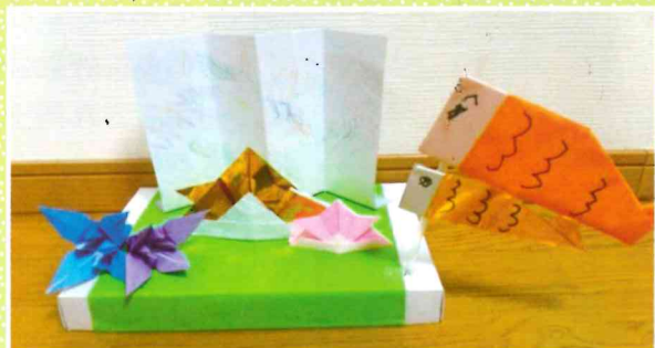
こいのぼり 作：ヘルパーステーション 熊谷一星さん